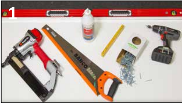
1 VERKTØY FOR MONTERING

Platene skal aklimatiseres ett døgn før montering og lagres tørt og liggende på et slett underlag.