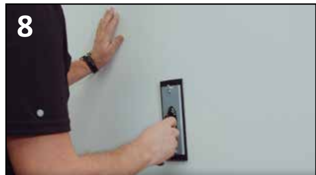
8 PUSS GJERNE LETT OVER SKJØTEN M/KORNING CA 150