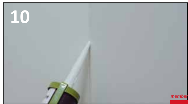
10 HUNTONIT AKRYLMASSE ANBEFALES TIL INNVENDIGE HJØRNER