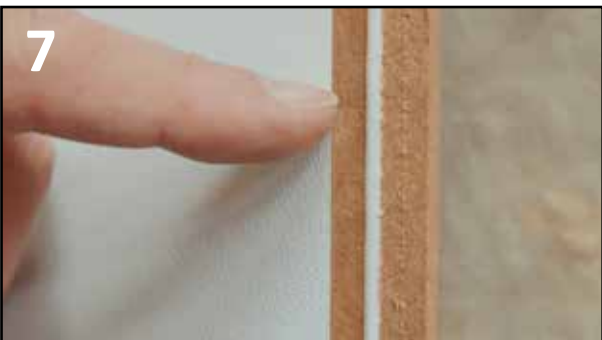
7 CA 1MM TYKK LIMSTRENG VINTERLIM NEDE I PROFILEN