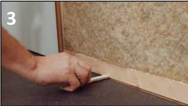
3 LØFT PLATENE 05-1,0CM OPP FRA GULVET,