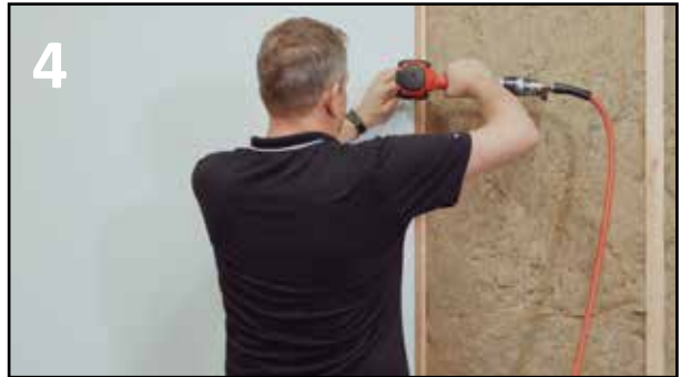
4 START MONTERING FRA VENSTRE MOT HØYRE. HUSK KUB- BING I HJØRNER SAMT VED DØR/VINDU