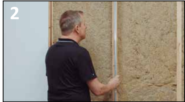
2 SJEKK AT VEGGEN ER HELT RETTE FØR MONTERING