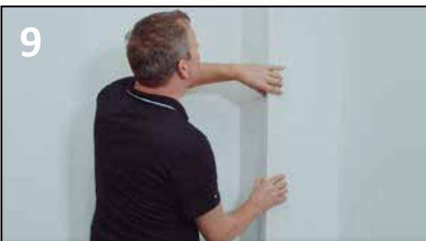
9 VELEGNET TIL LISTEFRIE LØSNINGER. VED UTVENDIG HJØRNE ANBEFALES SELVKLEBENDE FLEX LIST.