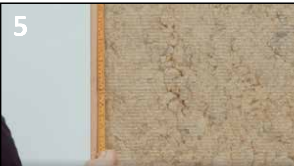
5 STIFTEAVSTAND PÅ STENDERE - 20CM. BENYTT HUNTONIT SKRUE ELLER KRAMPER MIN. 30MM