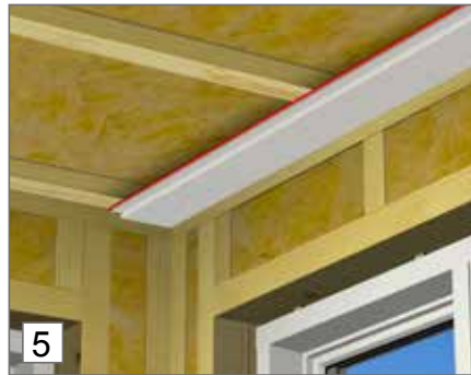
5. Asenna ensimmäinen rivi käyttämällä apuna merkintänarua. HUOMIO: Asenna noin 10 mm:n etäisyydelle seinistä.