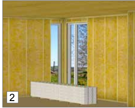
2. Paneelien on mukauduttava asennuspaikalla vallitsevaan lämpötilaan antamalla niiden olla kaksi vuorokautta pakkauksissaan huoneenlämpötilassa ennen asentamista.