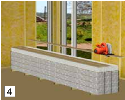
4. Sahaa ensimmäinen paneeli oikean levyiseksi. Sahattaessa sirkkelillä maalattu pinta on käännettävä alaspäin.