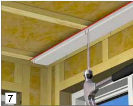
7. Kun naulaat paneeleita, käytä tuurnaa niiden vahingoittumisen estämiseksi.