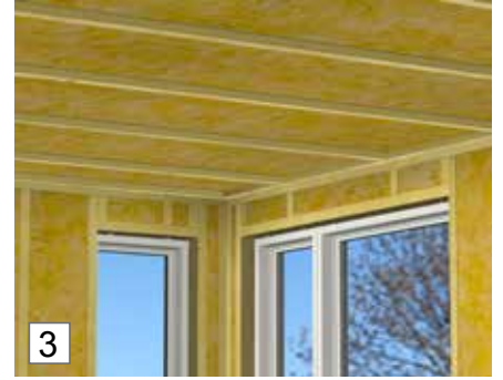
3. Asenna poikittain rimoihin tai palkkeihin nähden enintään 60 cm:n etäisyydelle toisistaan. Jos paneelit asennetaan valmiiseen kattoon, johon voi ruuvata, ne voidaan kiinnittää tarvitsematta ottaa rimoja tai palkkeja huomioon. Jos kattoon ei voi naulata tai ruuvata, paikanna palkit ja kiinnitä paneelit niihin.