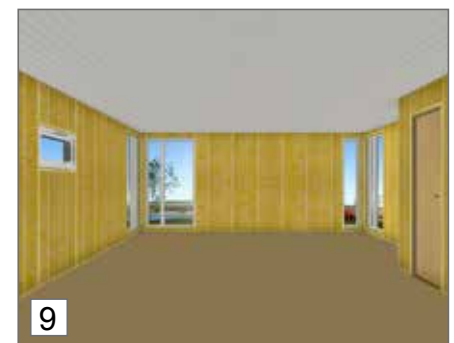
9. Asenna loput paneelit. Uusi Huntonit-kattosi on valmis!

Kaikkiin kattoihimme voidaan asentaa spottivalot.