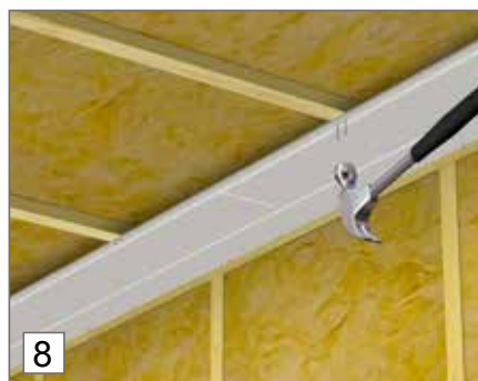
8. Paneelit on kiinnitettävä rimoihin tai palkkeihin. Niitä ei saa liimata.