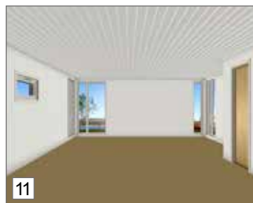
11. Uudet Huntonit-seinäsi ovat valmiit!