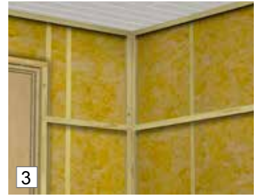
3/4. Aseta kalikat sisä- ja ulkokulmiin.