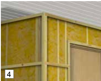
3/4. Aseta kalikat sisä- ja ulkokulmiin.