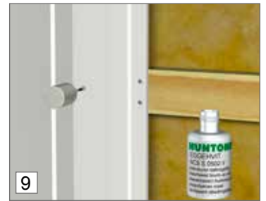
9. Naulanreiät voidaan peittää maalaamalla.