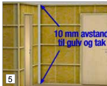
5. Sahaa ensimmäinen paneeli. Asenna 10 mm:n etäisyydelle lattiasta ja katosta.