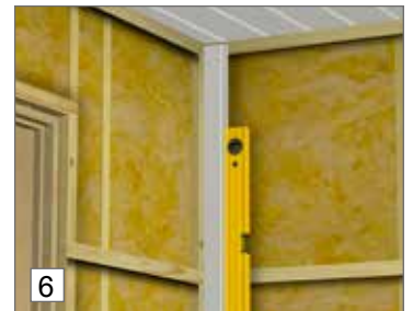
6. Käytä vesivaakaa, jotta asentaminen alkaa oikein.