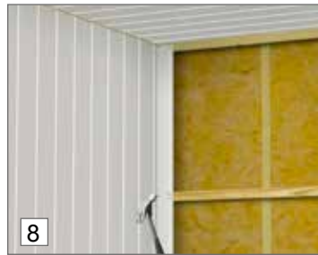
8. Levyt on naulattava tai ruuvattava rimoihin kahdesta kohdasta.