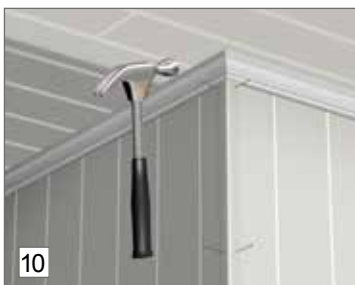
10. Ulko- ja sisäkulmissa voidaan käyttää Huntonit-kulmalistoja.