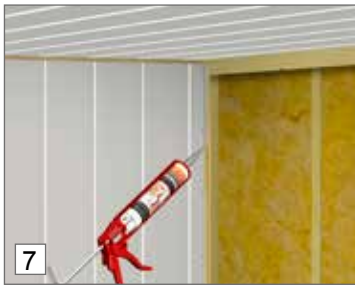
7. Liimaa uuden seinän ensimmäinen paneeli Casco superfix- tai PL 400 -liimalla.